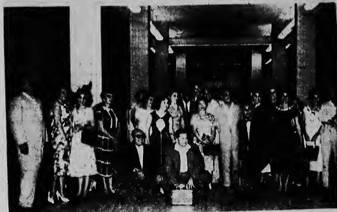
Aki nos ta mira un den vestibulo di e estacion di Princesa Beatrix aeropuerto.